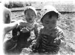
ちょうだい！どうも！