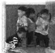
つるん！クラクラ～！ ちょっと、ときどきがおもしろい！