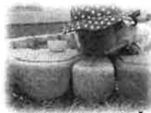
たんごおしさん！ どこいくの？