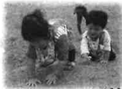
ころんでもへっちゃらだよ！ みてて！おやまにのほれるよ♪