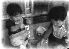
こうやって、はくの？