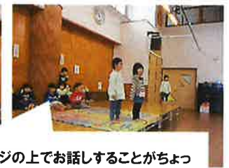
ステージの上でお話することがちょっと恥ずかしい姿も…

初めての話し合いでは、歌を歌いたい！の一択でした。子どもたちのやりたいことを大事にし、どんな風に歌を行うかを考え、カラオケみたいにしようか？歌を歌うだけにしたい？などの話し合いをして、歌はどんな歌にする？と聞くと、『鬼滅の刃！』『エヴァンゲリオン！』『プリンセス！』など人気のある曲がたくさん出ました。しかし、話し合っていくうちにみんなで歌えて覚えやすいほうがいいかもしれないということに気づき、今回の曲に決めました。