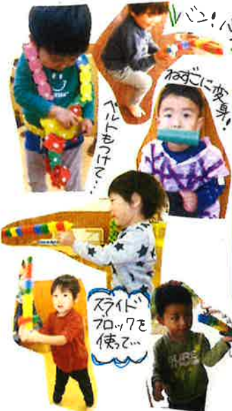
スライド ブロックを 使って...

初めての遊戯室では、子ども達はなりきって勇敢に戦う姿が見られていました。発表会当日は緊張しながらもステージで鬼と戦い、お部屋では「楽しかった」という姿が見られました。緊張しながらも子ども達なりにステージに向かう姿は、いつもの姿とは違ってとても大きく見えました。