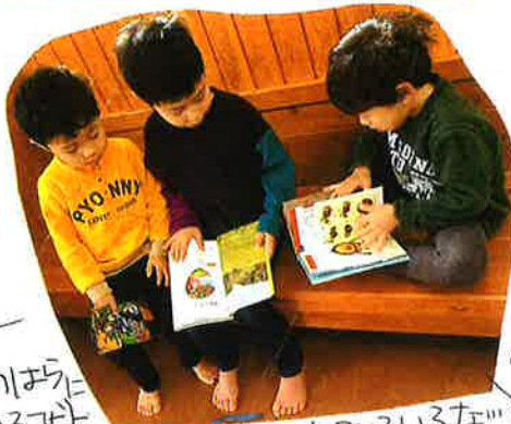
のまに いるゴビト