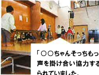
「○○ちゃんそっちもって！」と声を掛け合い協力する姿も見られていました。

発表会に向けて、どんなことをしたいか、どんなやり方にするかなど子どもたちで話し合い、発表会に向けて練習をしていき、発表会本番を迎えることができ、発表会が終わった後には、子どもたちの顔からは達成感や満足感があふれ出ていました。