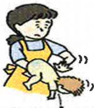
図1 背部叩打法(乳児)