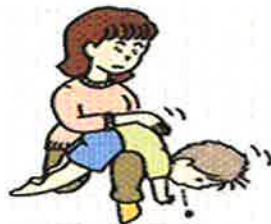
図2 背部叩打法(少し大きい子)