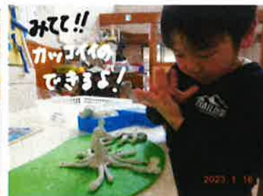
みて！！ カッパの できるよ！！