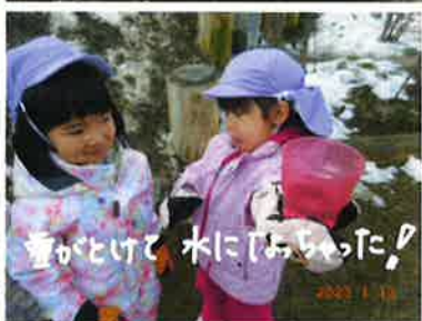
雪がとけて、水に「はたはた」