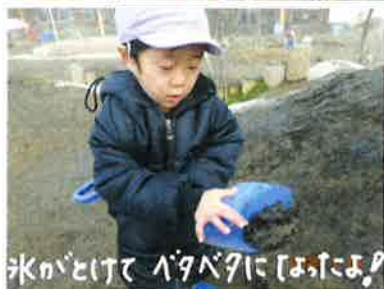
氷がとけて、バタバタに「はたはた」