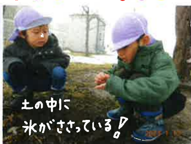
土の中に氷がささっている！