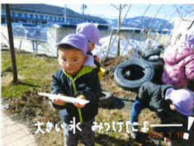
大きい氷 みつけに！

雪が降るとすぐに解けてしまう、いつもより暖かい今年の冬！にも関わらず、毎日雪だるまを作り始める姿に、自然を受け止めて向き合おうとする姿や、物事に対する根気強さ、たくましさを感じられるようになってきています。経験から色々な事を思い出し、こうしたことあるよ！こうかな？違うかな？やってみよう！など、友達と一緒に会話を交わしながら、考えたり、観察したり、挑戦したりして過ごす時間が、楽しくて仕方がない毎日です。