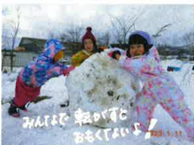
みんなと転がるとおもてたいよ！