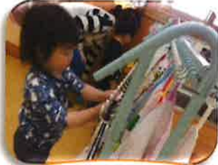
わたしのエプロンあった！

おうちの人や先生と、やりとりを楽しみながら、できた事を一緒に喜べる経験をたくさん積んでいきたいですね。その経験を通して”聞いてくれる” ”見守ってくれる” ”話してくれる” 安心感を育んでいきたいと思っています。