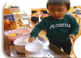
おつゆのお皿はここかな？