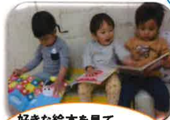
好きな絵本を見てこれはなに？なんだろうね？やりとりって楽しい！