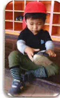
どうやったら履けるかな...？ 難しいな～