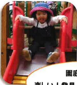
園庭あそびは楽しい！発見！刺激がいっぱい♪