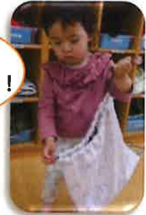
エプロン、衣服を袋に入れられた！できたよ！