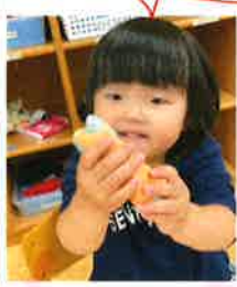
くるくる のたまき