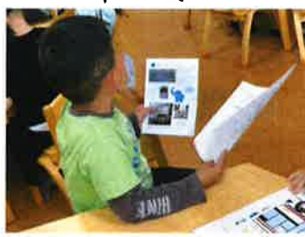
話しているバスの先生の 方へ向いて聞いてみたり...