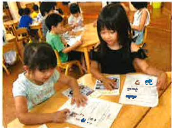
読んでいる場所を 手で追ってみたり...