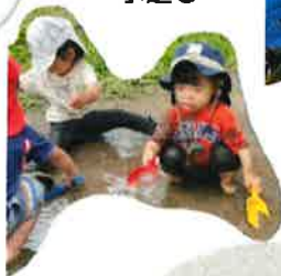
いっしょに水遊び