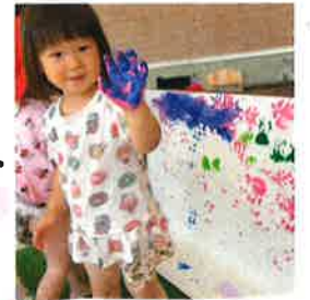
せんせー! つきは あお、つけるよ!!

優しく握ると気持ちいいねー 手にいっほい付けるべらべらだねー ギュッと握ると水がこぼれたね!! これは〇色、てゆうんだよ。 ほっぺにくっつけると冷たくて気持ちいいねー 手と指の開くが休いたねー