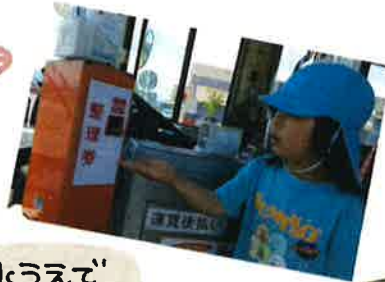
初めまして の乗車券 との出会い