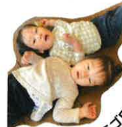
いっしょにゴロー