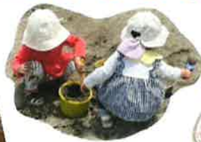
いっしょに砂遊び