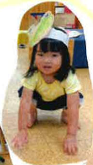
わたしたち、 ほぐたちは...