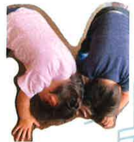
いっしょに葉っぱを あげてみよう